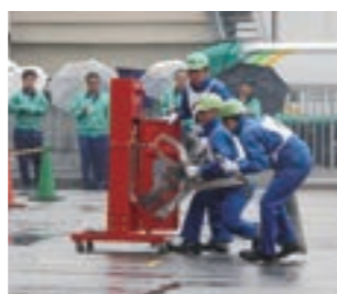
消防競技大会では訓練通りの成果を収められました

消火設備を毎月点検して防災意識を高めるとともに、消火訓練を年1回実施しています。また、自衛消防隊の訓練成果を図るために参加した東大阪市消防競技大会で優勝しました。2014年から東大阪市消防出初式のクライマックスで使用する有色放水の着色剤を提供しています。