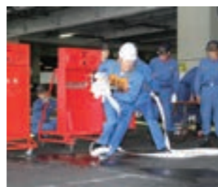
正確かつ素早い行動に高い評価をいただきました