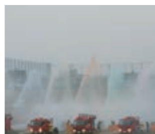
有色放水で使用する着色剤は環境に配慮して選定しています