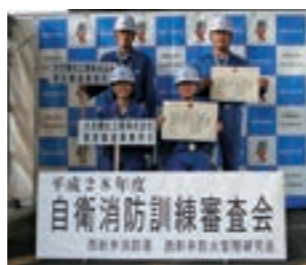
消火栓の部で男子隊、女子隊ともに優勝しました

火災発生を想定した避難と初期消火、救護を行う総合訓練と大地震を想定した地震発生から避難・救護、インフラ確認を行う防災訓練を実施しました。自衛消防隊の訓練成果を図るために参加した西新井消防署主催の自衛消防訓練審査会で優勝しました。