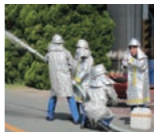
消防車を2台保有し、自衛消防隊の訓練と機械動作確認を実施しています