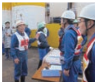
全員参加の訓練を継続して行っています

泡消火器などを使った実践的な総合防災訓練を年2回、南海トラフ大地震を想定した緊急地震速報の発令から避難・救護、火災や化学物質漏えいなどの事故に対応した訓練を年1回実施しています。消火隊訓練や職場ごとの緊急事態対応テストなどを通して、定期的な機器点検とともに、災害初動訓練を繰り返し行っています。