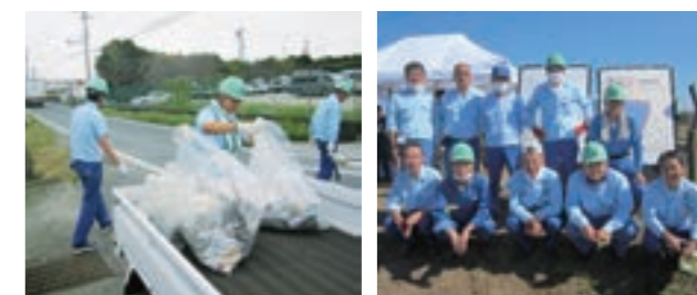
周辺道路清掃のほか、祝川近辺の草刈りなども行っています

2010年から磐田市の「まち美化パートナー制度」に登録して、事業所周辺の道路や河川の美化・保全活動に参加しています。また、磐田市環境保全推進協議会にも協賛し、地下水涵養事業では市職員や他の協力企業の方々とともに、環境保全活動に参加しています。静岡県立浜松工業高校生徒への工場見学会では、顔料発色実験などを通して、当事業及び事業所活動への理解を深めていただきました。