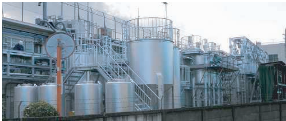
写真5. H22年1月 [機器据付完了] 南東から撮影