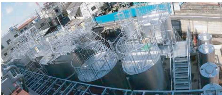
写真6. その他付帯設備